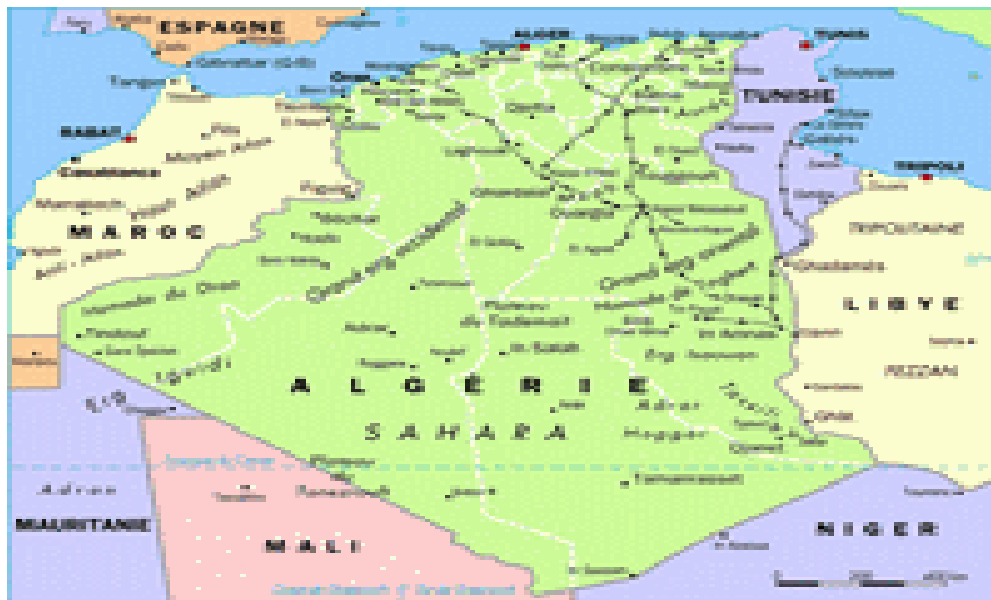
Figure 1. Situation géographique de l'Algérie

L'Algérie est située au centre du continent Nord-africain, avec une superficie de 2.381.741 km 2 , elle est le plus grand pays en Afrique. Avec près de 1600 Km de côte sur la mer Méditerranée, elle est bordée à l'Est par la Tunisie, au Sud Est par la Libye, au Sud par le Niger et le Mali, au Sud-Ouest par la Mauritanie et à l'Ouest par le Sahara Occidental et le Maroc (voir figure 1).